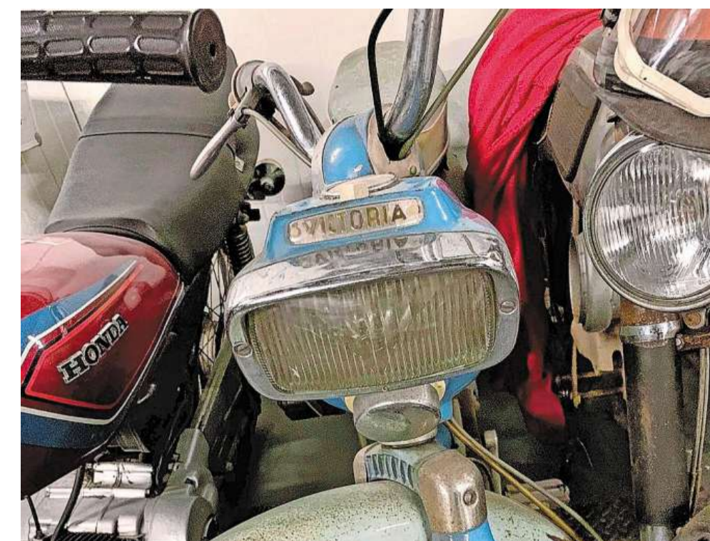
„Deze gaan we ook opknappen.”