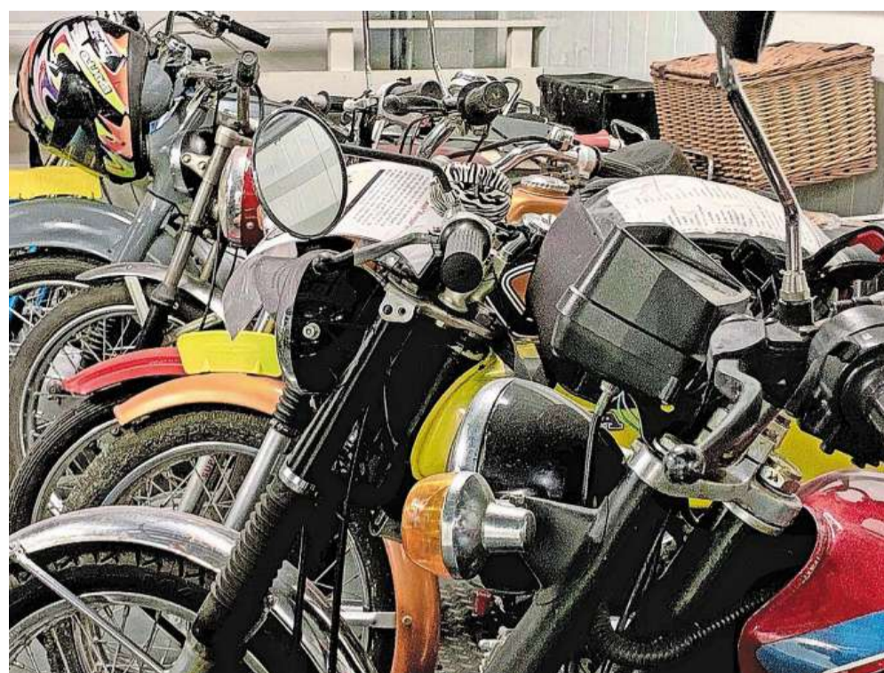
In de rij; sommigen om mee te rijden, anderen voor herstel.