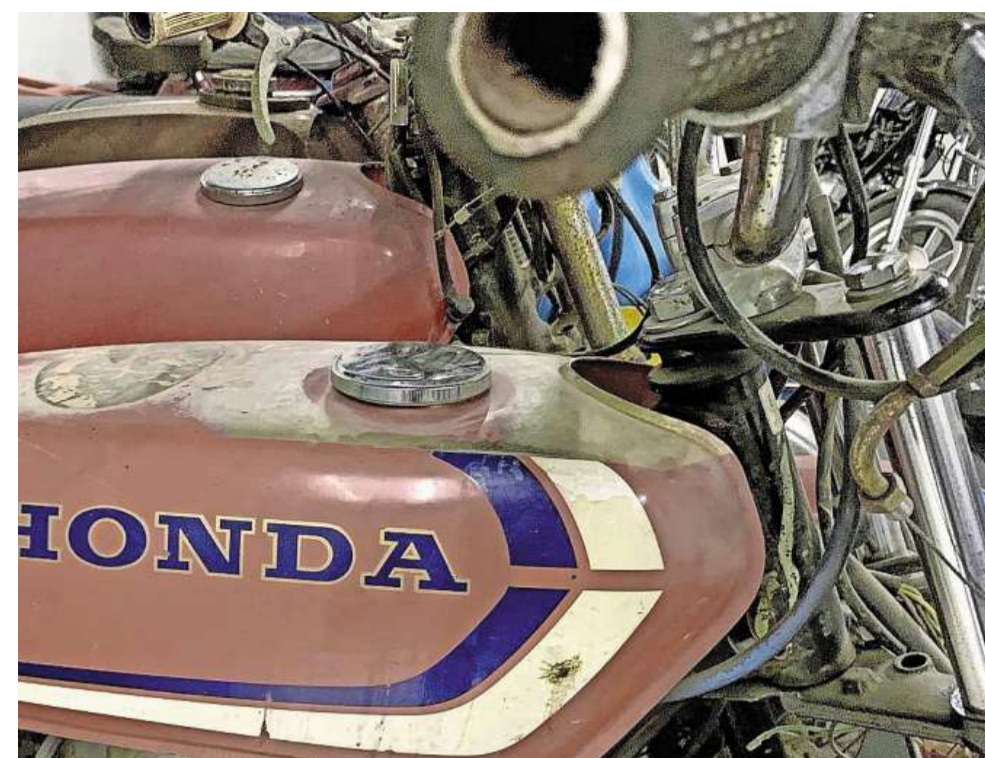
Stoffige Honda-glorie van weleer.

Lekker sleutelen aan een brommertje in coronatijd raakt in trek